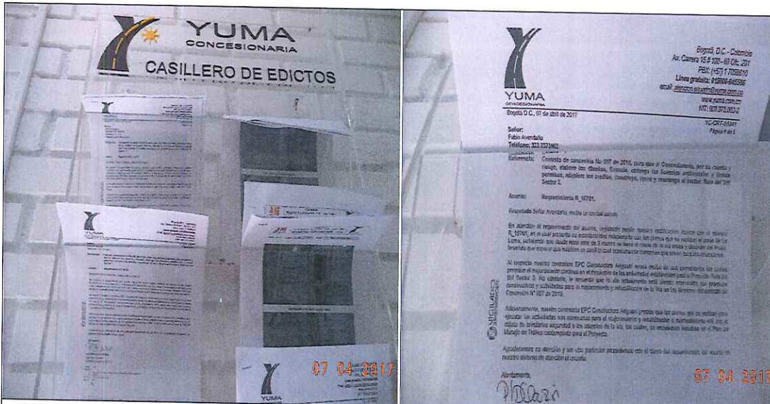
PUBLICACION DE EDICTOS R_16761

Fecha: (d-m-a) 07 04 2017 Lugar Oficina de Atención al Usuario -CCO